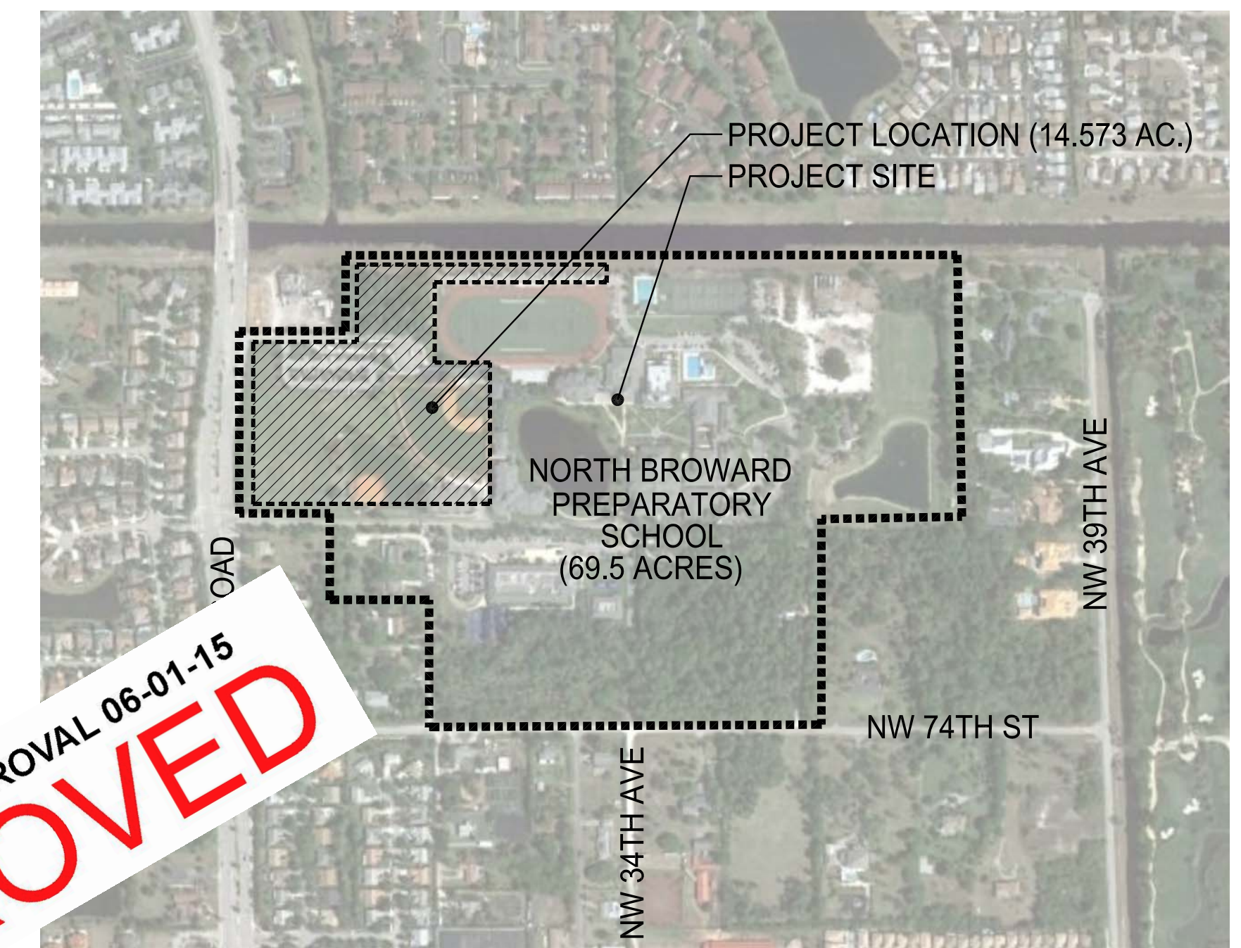
LOCATION MAP NTS

ADMINISTRATIVE APPROVAL 06-01-15 APPROVED